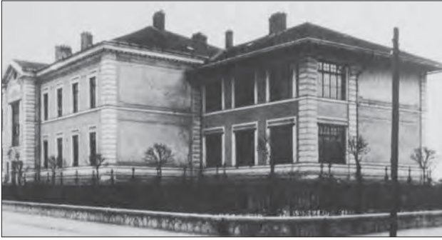
Ljubljanska ubožnica leta 1901.