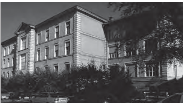
Klinika za gastroenterologijo v Ljubljani.

Leta 1969 se je v to stavbo preseli gastroenterološki oddelek Interne klinike. Ker je bila stavba v slabem stanju so leta 1972 pričeli z adaptacijo, s katero so v kleti stavbe pridobili oddelek za endoskopsko, ultrazvočno in radiološko dejavnost. Istočasno so adaptirali tudi preostali del stavbe, s čimer so pri-